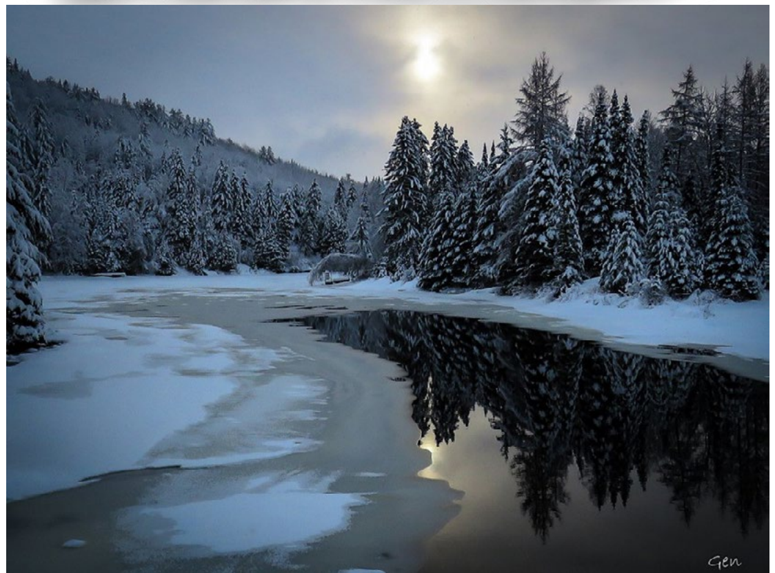
Photo : Réflexion sur le lac de la Fromentière.

Toute l'équipe de la municipalité de Saint-Alphonse-Rodriguez vous souhaite un temps des Fêtes chaleureux et rempli de moments magiques. Joyeux Noël et bonne année à tous!