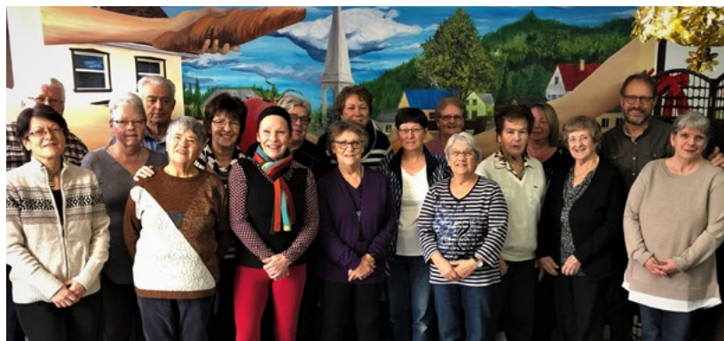
Les bénévoles du comptoir vestimentaire

Saviez-vous qu'il existe à Saint-Alphonse-Rodriguez un organisme qui peut donner une seconde vie aux objets dont vous souhaitez vous départir? En effet, le Comptoir vestimentaire récupère les vêtements, les jouets, les livres, la vaisselle ainsi que les petits appareils électroménagers et électroniques qui leur sont donnés afin de les revendre à prix concurrentiels.