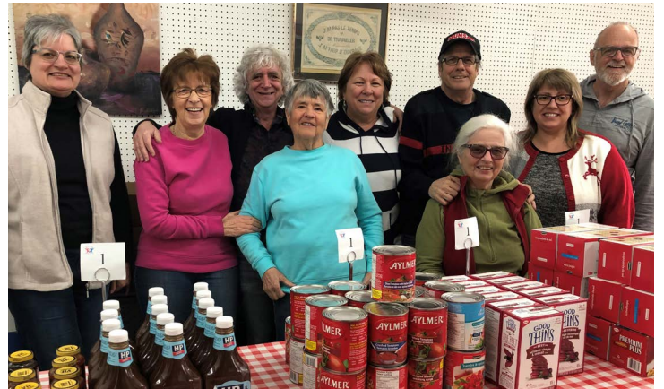
Une partie de l'équipe de bénévoles du groupe Entraide et amitié Saint-Alphonse.

Depuis de nombreuses années, les bénévoles du groupe Entraide et amitié Saint-Alphonse travaillent fort pour offrir des services aux personnes qui traversent des périodes plus difficiles. Financé principalement par la Guignolée des pompiers qui a lieu en décembre chaque année ainsi que par les dons et commandites reçus, l'organisme réussit à offrir toutes les semaines des aliments et produits variés. Au total, ce sont environ 100 personnes seules, couples ou familles qui bénéficient des services sur le territoire de la Municipalité.